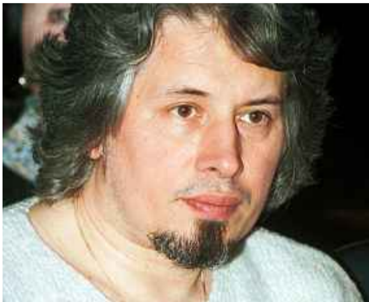
NØTT: Vladimir Sorokin er blitt betegnet som et grusomt talent, og et ledende monster i russisk litteratur.